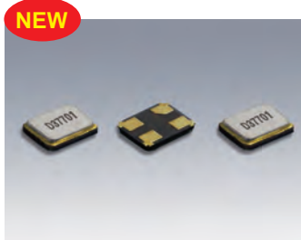
DSX1612SL 原寸大 □