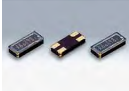
原寸大 □ DST621